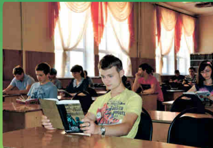
На фото: за работой в библиотеке.

В этом номере мы открываем новую рубрику «Из жизни одного отдела», цель которой - разнообразнее и полнее рассказать о повседневной жизни и деятельности отделов, их сотрудников. Сегодня мы остановимся на работе библиотеки.