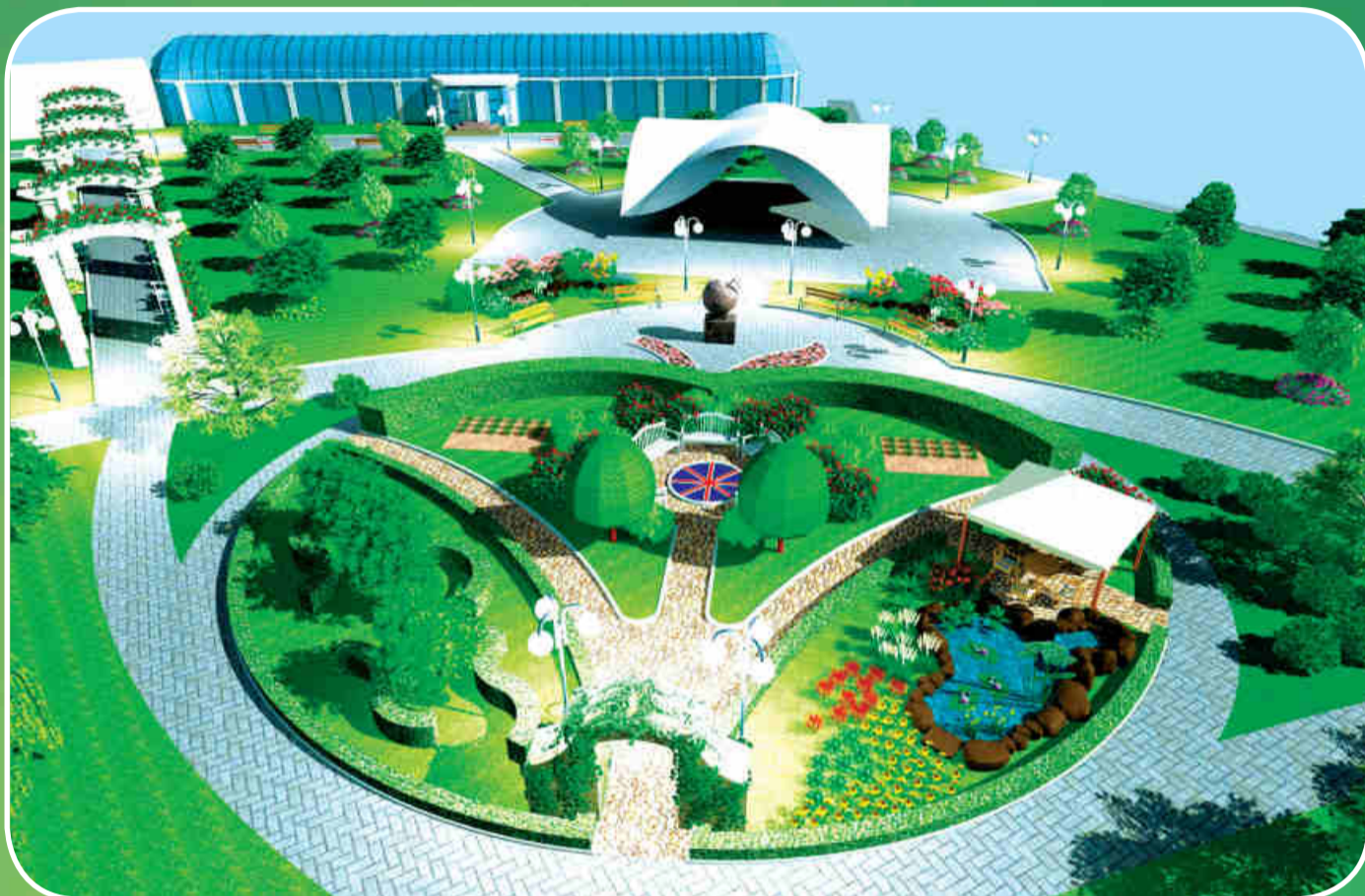
На фото: проект Парка достижений садоводов мира. Дизайн проекта разработан старшим преподавателем кафедры ландшафтной архитектуры, землеустройства и кадастров Плодоовощного института им. И.В. Мичурина Г.С. Рязановым.

Издается с июня 1999 г. № 9 (151), октябрь 2016 г. Возрастная категория 6+