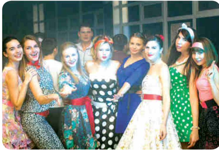
На фото: на дискотеке в стиле 50-х годов.

В планах профкома студентов еще много мероприятий, направленных на организацию отдыха и досуга, всестороннее развитие обучающихся. Например, танцевальное шоу «Осенний батл», организация участия студентов вуза в различных городских и обще-