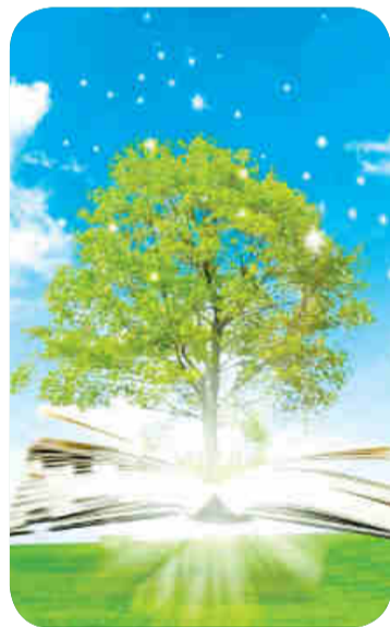
На фото: дерево знаний.

Мне очень жаль тех людей, которые не понимают значимость и важность именно печатной книги.