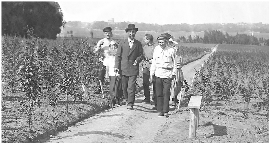
Первая фотография Владимира Иванова, посвящённая Мичурину

Десяти работ козловских мастеров светописы хранятся в фондах музея. Наиболее знаковые из них вошли в экспозицию. Для показа на выставке фотографии пред-