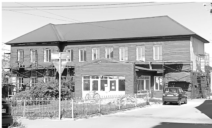
Здание детской поликлиники по улице Революционной

В Мичуринске произошло объединение трёх медицинских учреждений