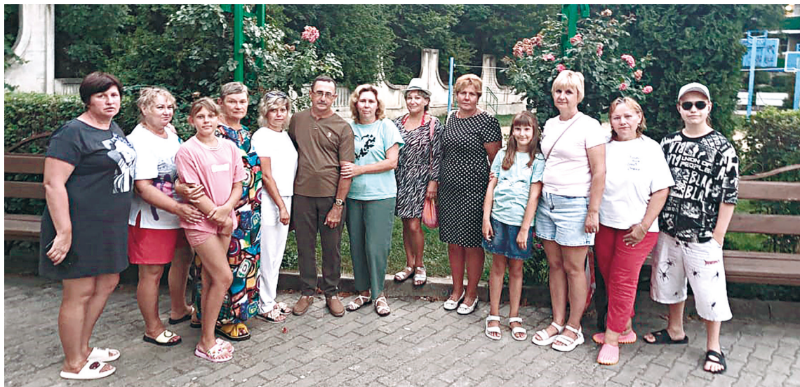
Сотрудники в пансионате «Ставрополец»

На праздничных концертах, утренниках постоянные гости с малышами — сотрудники, находящиеся в отпуске по уходу за ребёнком. Они и в эти годы продолжают поддерживать